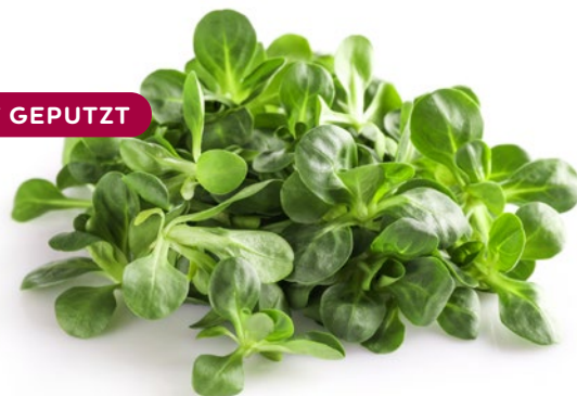
NAPURO FELDSALAT GEPUTZT