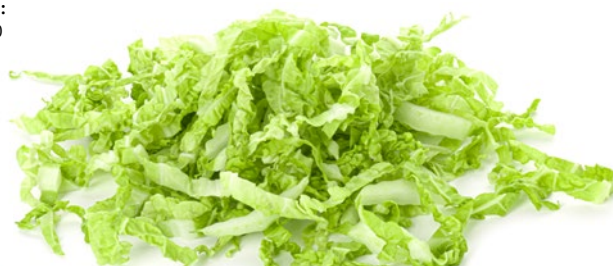
NAPURO CHINAKOHL GESCHN. 10 MM