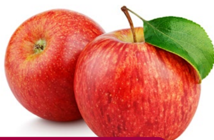
APFEL ROT KLEIN 100-130 G